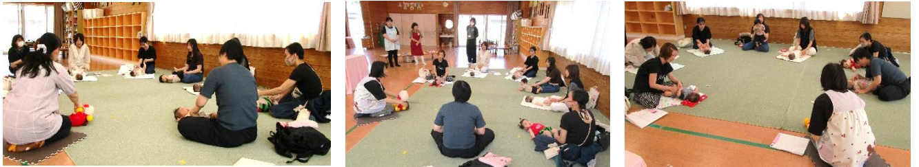
初めてのふれあい遊びでお母さんとたくさんふれあいました。赤ちゃん達は、気持ち良さそうにしていました。