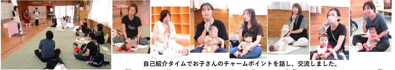
自己紹介タイムでお子さんのチャームポイントを話し、交流しました。