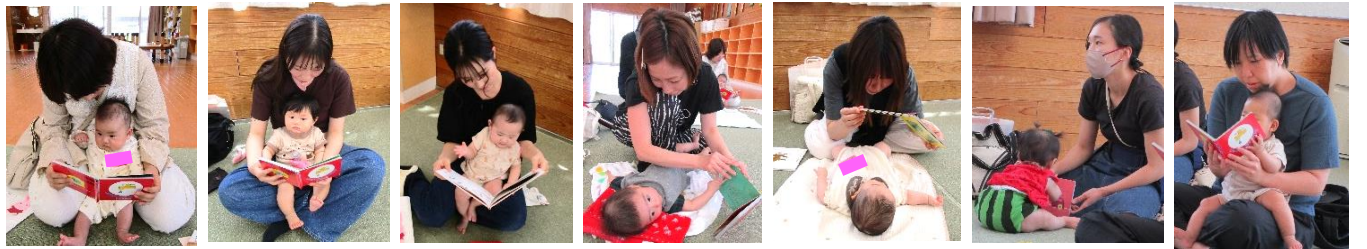
お母さんと赤ちゃんの絵本タイムの様子。お母さんの優しい声に包まれながらみんなじっと絵本をみつめていました。