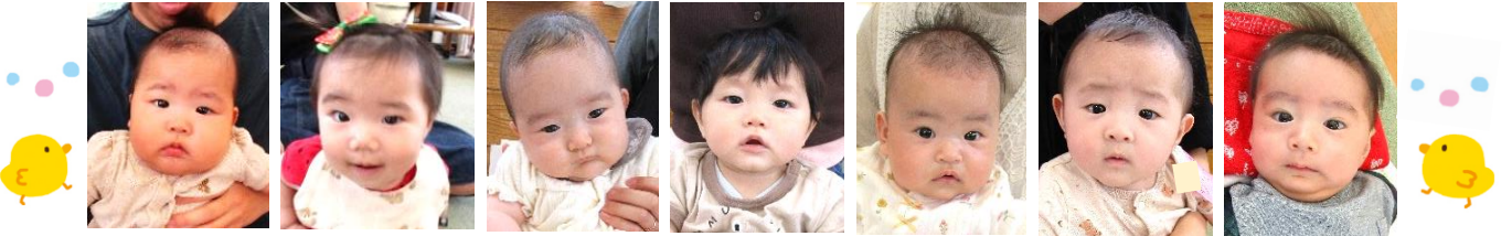
3～6ヶ月の可愛い赤ちゃんが7人集まってくれました♡