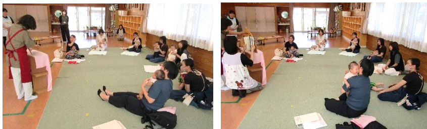
子育てボランティアさんによる紙芝居の読み聞かせで、赤ちゃん達はじっと見てくれていました。