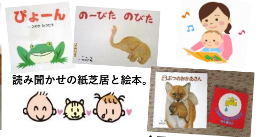
読み聞かせの紙芝居と絵本。