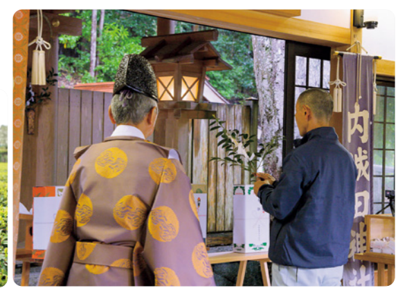
玉串を奉納する町茶業組合中森組合長