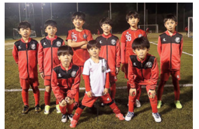
チームで活躍している度会スクール出身選手 ※1~6年生