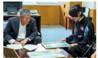
6月18日、役場にパステルアートをご寄贈いただきました。(町地域交流センターに設置予定)

る発作で、東京都では体調が安定しなかったものの、度会町に戻ってからは快方に向かっており、安心して暮らせるようになりました。